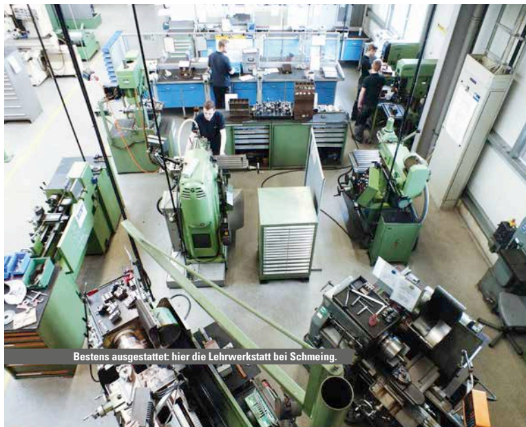
Bestens ausgestattet: hier die Lehrwerkstatt bei Schmeing.

Schmeing steht für eine über 200-jährige Unternehmensgeschichte, die wir gern mit dir fortführen möchten.