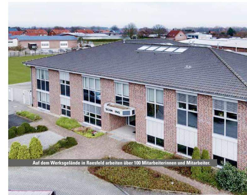
Auf dem Werksgelände in Raesfeld arbeiten über 100 Mitarbeiterinnen und Mitarbeiter.