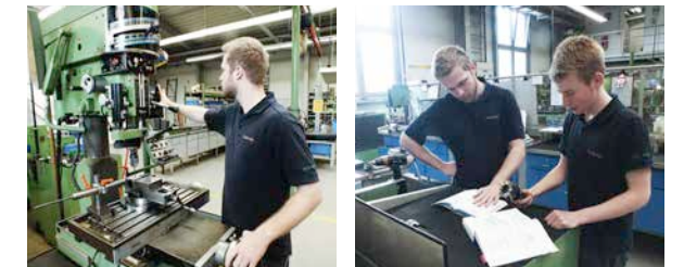
Learning by doing: Bei Schmeing lernst du zusammen mit deinen Kollegen, indem du eigene Projekte durchführst.

Dazu stellst du mitunter Geräteteile selbst her, baust Produktionsanlagen um und überwachst und optimierst Fertigungsprozesse. Du wirst bei uns ausgebildet zum Profi in Sachen Fehlersuche, Reparatur und Optimierung. Das sind Fähigkeiten, die dich zu einem nachgefragten Mitarbeiter machen und die du sehr gut auch Zuhause im Privaten anwenden kannst.